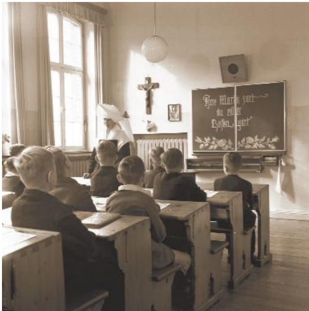
St. Johannes-Stift Marsberg: Unterricht um 1950