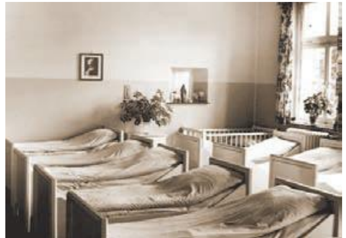
St. Johannes-Stift Marsberg: Schlafsaal um 1950